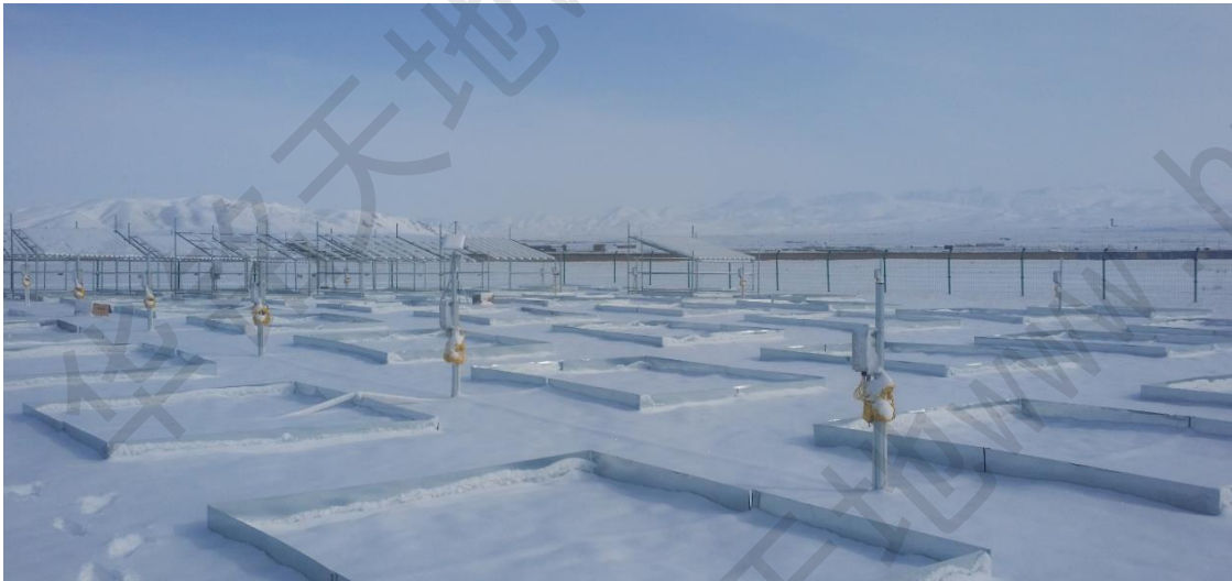
图 3 多样地矩阵式土壤温湿盐系统