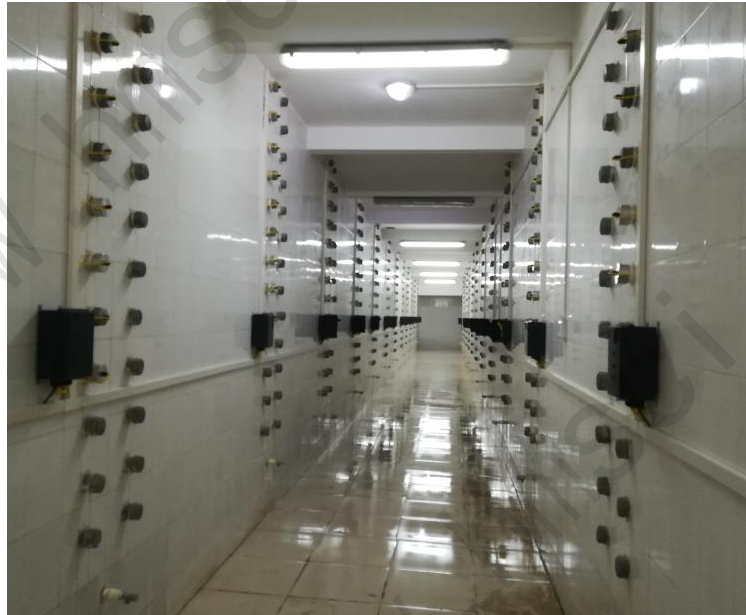
图 2 大型蒸渗仪矩阵式土壤温湿盐系统

注：1 《. 土壤温湿盐观测系统矩阵群并行采集软件》是我司与用户单位共同申请的软件著作权。